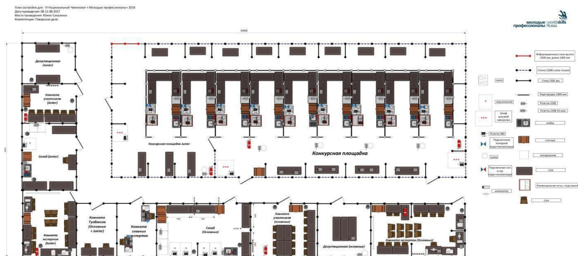
Схема конкурсной площадки (см. иллюстрацию).